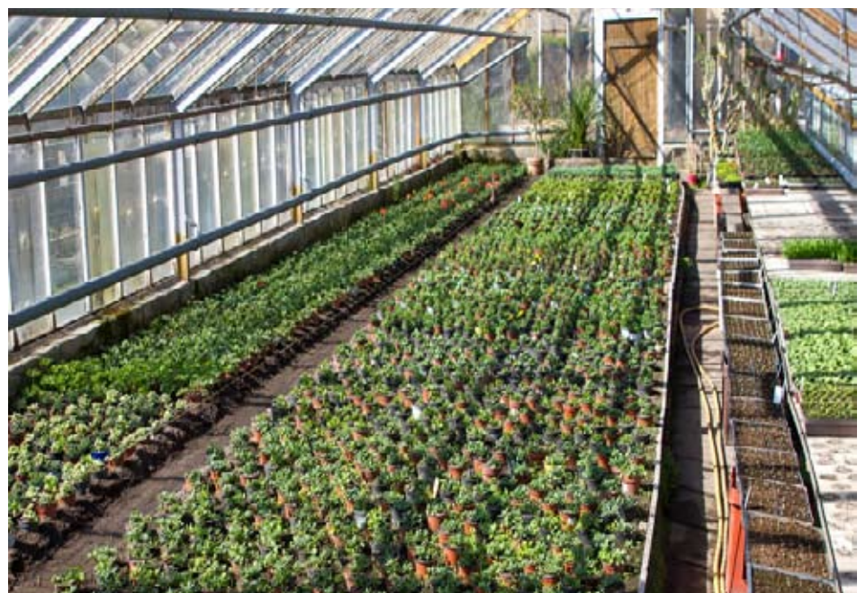
Die Gewächshäuser der Gärtnerei Hauptig sind gut mit Jungpflanzen gefüllt, die nur darauf warten, ins Freiland ausgepflanzt zu werden. Bestellungen können bei uns abgegeben werden.