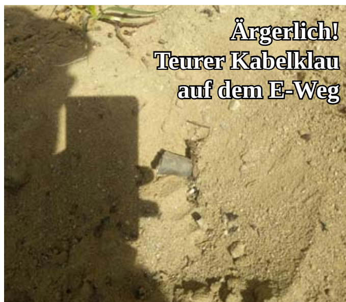
Schnipp-schnapp Kabel ab :- ( Foto: F. Thiere

Dieser Anblick bot sich unserem Sparten elektriker Frank Thiere vergangene Woche. Und zwar ein besonders ärgerlicher. Da sind unsere ehrenamtlichen Einsatzkräfte vorausschauend und verlegen bei Erdarbeiten Kabel für die Wegebeleuchtung. Doch es gibt offenbar Gartenfreunde die meinen schlauer zu sein und diese Kabel für den eigenen Verbrauch abschneiden. Der Diebstahl von ganzen 5 m Kabel ergibt damit einen Sachschaden von über 500 €. Zeugenhinweise nehmen wir gern entgegen! Und übrigens: Asozial sind nicht die, die dem Vorstand so etwas melden, sondern jene Vollidioten, die sich auf so primitive Art auf Kosten aller bereichern.