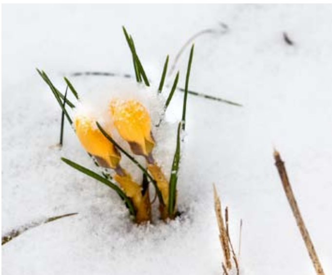
Manche Frühblüher werden von Schnee und Kälte überrascht.

Schneeglöckchen, Krokus oder Winterling sind die ersten Boten des Frühlings, wenn auch manchmal etwas vorschnell. Normalerweise überstehen diese Pflanzen eine nachfolgende Frostperiode, sie legen einfach eine Wachstumspause ein. Dennoch ist es sinnvoll